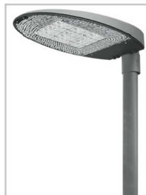
Esempi di apparecchio stradale a vetro piano (foto 1)