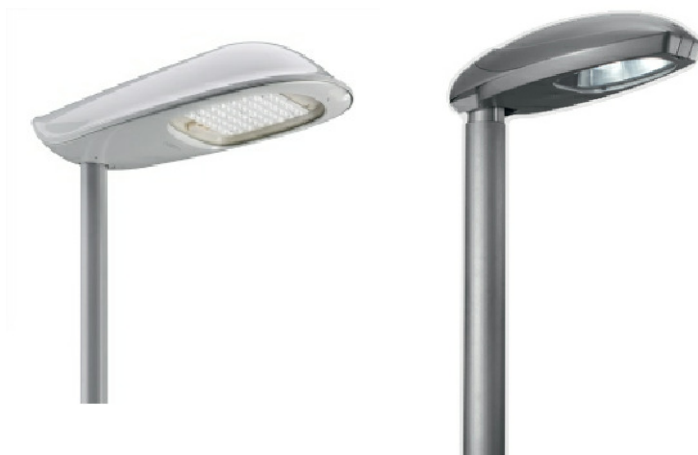
Esempi di apparecchio stradale a vetro piano (foto 1)

Per l'individuazione puntuale delle strade si veda la tavola 2013010PL-FA-ZI01